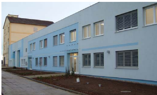
Nové sídlo společnosti TOI TOI

Společnost TOI TOI, sanitární systémy, s r.o. od začátku roku 2005 začala tedy působit ve svém novém sídle ve Slaném, ale také nadále rozvíjí a podporuje své pobočky po celé republice. Regionální pobočky sídlí v Českých Budějovicích, Plzni, Brně a Hradci Králové. Firma tedy pokryla celé území naší republiky a především dokáže snadno, rychle, kvalitně a především ekonomicky zajišťovat svou činnost.