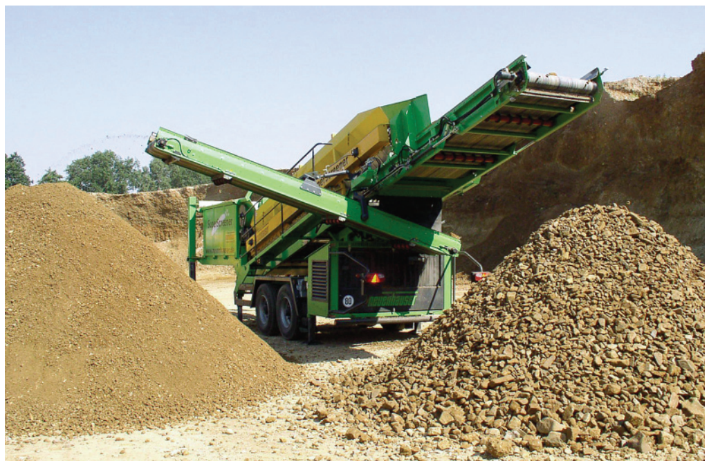
SuperScreener - třídění suroviny – těžebný štěrku

Obdobná situace je u hald, kde pro další zpracování je potřeba oddělit prachovou část materiálu. Ostatně těchto vlastností SuperScreeneru – bezproblémové zpracování lepidivých materiálů se využívá i v jiných oblastech. Např. při třídění štěpek, kompostů, zpracování sintrů atd.