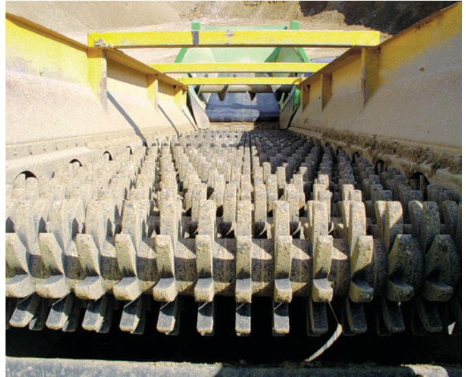
Hvězdicové prosévací pole

Pro likvidaci odvalů a hald se u SuperScreeneru na násoypný bunkr namontuje sklopný rošt, který provede hrubé předtřídění materiálu. U odvalů přináší výrazný zisk, který spočívá: