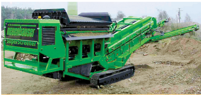
SuperScreener na pásovém podvozku se sklopným roštem