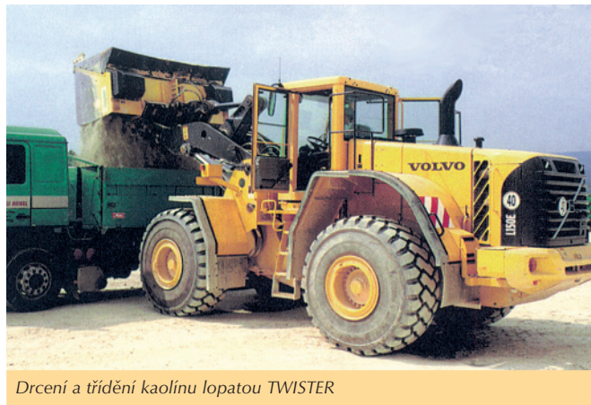
Drčení a třídění kaolínu lopatou TWISTER

Z hlediska údržby je snadná výměna zubů mezi disky nebo kladiv u MUDBUSTER. Jejich svislé hřídele jsou krátké a neprohýbají se tolik jako vodorovné. Hydromotory