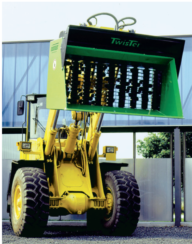
Lopata TWISTER na nakladači

upevňovací desku a adaptér se navrhuje podle příslušného stroje. Rozteč mezi disky na hřídelích se volí s ohledem