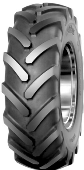
Obr. 1: Diagonální plášť EM-02 (Earthmover) pro velké stavební stroje

V oblasti výroby zemědělských pneumatik patří společnosti MITAS a.s. dle dostupných údajů pomyslná druhá příčka v Evropě za firmou Michelin. V celosvětovém měřítku je na čtvrté pozici hned za trojicí největších světových výrobců (Michelin, Goodyear, Bridgestone). O kvalitě zemědělských a mimosilničních pneumatik svědčí fakt, že jsou dodávány na první výbavu řadě významných výrobců jako jsou John Deere, CNH, Claas, Caterpillar, Liebherr, Terex, JCB a další.