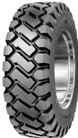
Obr. 2: Pneumatika EM-60 je jednou z téměř čtyřiceti možných variant uceleného programu diagonálních EM plášťů

nových strojích Marangoni revoluční technologií nanášení běhounu a bočnice v jednom souvislém kuse. Tato technologie výrazně zlepšila kvalitu EM pneumatik a společnost MITAS a.s. se díky ní zařadila mezi neznámější výrobce pneumatik pro velké stavební stroje.