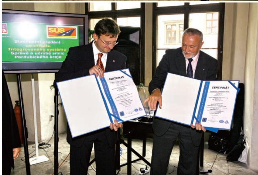
Slavnostní předávání certifikátů ČSN EN ISO 14001:2005 a OHSAS 18001:1999

ní servis v oblasti silničního hospodářství jako údržba opravy povrchů komunikací, údržba a osazení dopravního značení, doprava a mechanizace, prodej materiálů pro zajištění zimní údržby silnic. V loňském roce výkony v této oblasti přesáhly částku 100 mil. Kč.