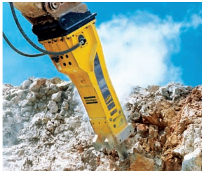
Těžké bourací kladivo HB 5800