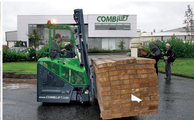
Sídlo firmy a před ním manipulační vozík Combilift