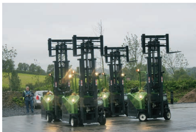
Tanec vozíků nezkazilo ani deštivé počasí