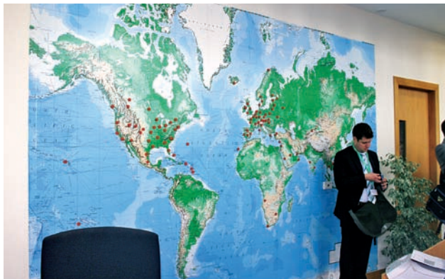
Mapa, která dokumentuje, kam všude se vozíky Combilift vyvážejí

Poté jsme se přesunuli do výrobních hal. Zde jsme měli možno zhlédnout celý cyklus výroby vozíku. V jedné hale se svářely jednotlivé díly vozíku, ty potom putovaly k nástřiku a lakování, hotové části se postupně montovaly tak, že se vyráběl podvozek s koly, následně