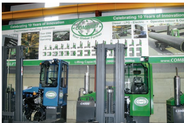
Krátce před zahájením vystoupení