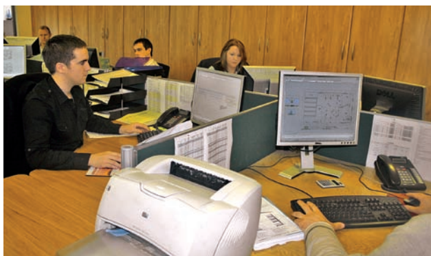
Oddělení s počítačovými experty