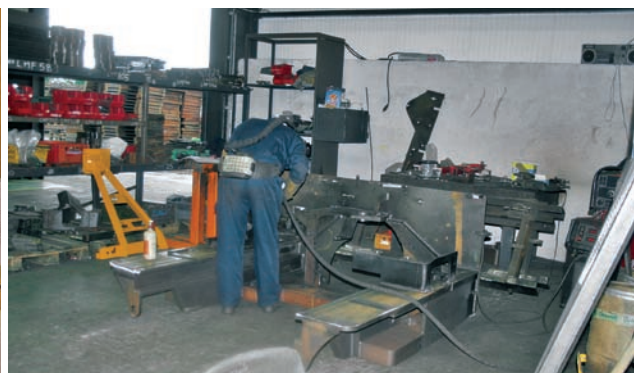
Sváření jednotlivých dílů