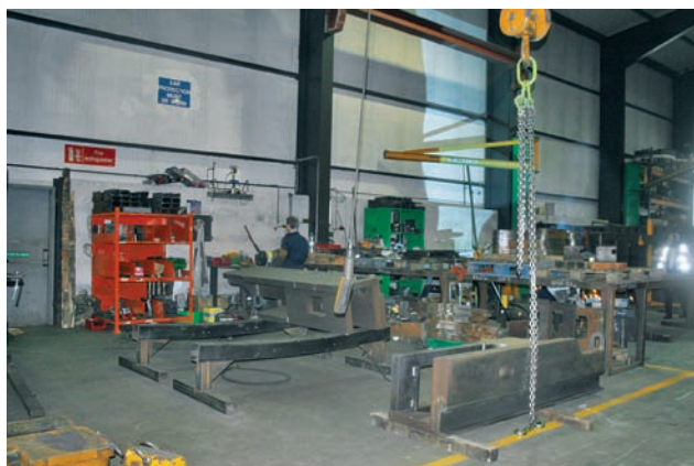
Převaha již svařených dílů k nástřiku