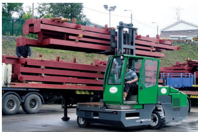
Combilift při nakládce