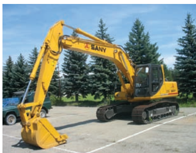
Pásové rypadlo SANY 210C

Continual Improvement – zásada neustálého zlepšování je neodmyslitel-